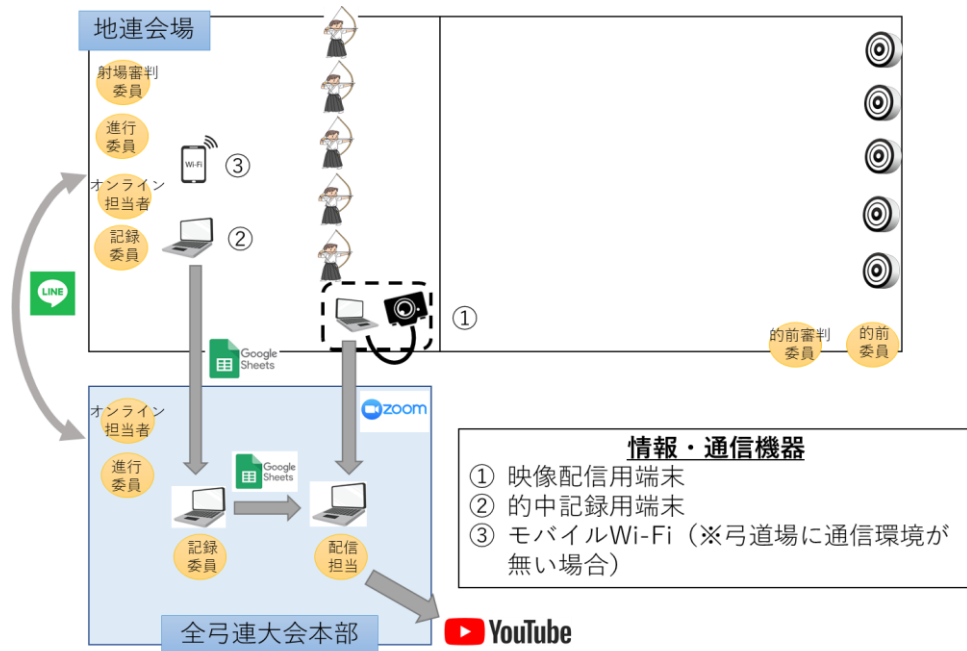
図1. 地連会場における機器・運営委員配置例と大会本部との情報共有方法