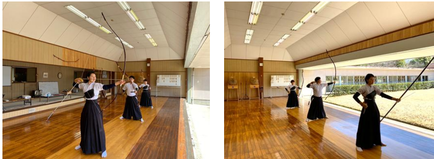
図2. 映像配信用カメラの撮影映像例

選手を含め、本座一步前までの全体を常時撮影できる位置に設置してください。行射ごとに、カメラを移動させる必要はありません。図2左の映像が撮影できる位置（脇正面的側）からの撮影を行ってください。図2右の映像が撮影できる位置にカメラを設置することが難しい場合は、図2右の映像が撮影できる位置（脇正面本座側）から撮影を行ってください。