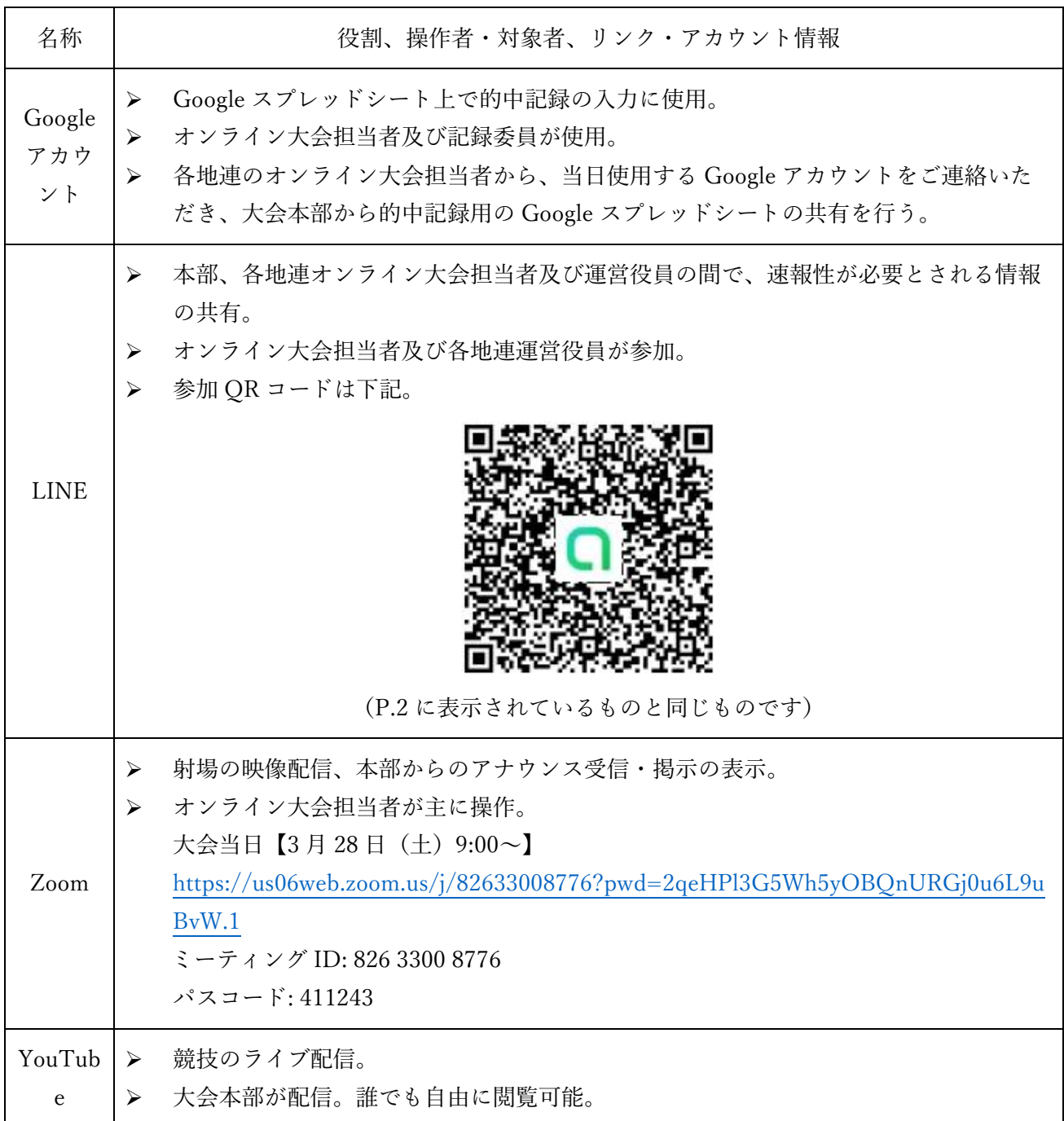
表 1. 各サービスの名称と役割、操作者・対象者、リンク・アカウント情報